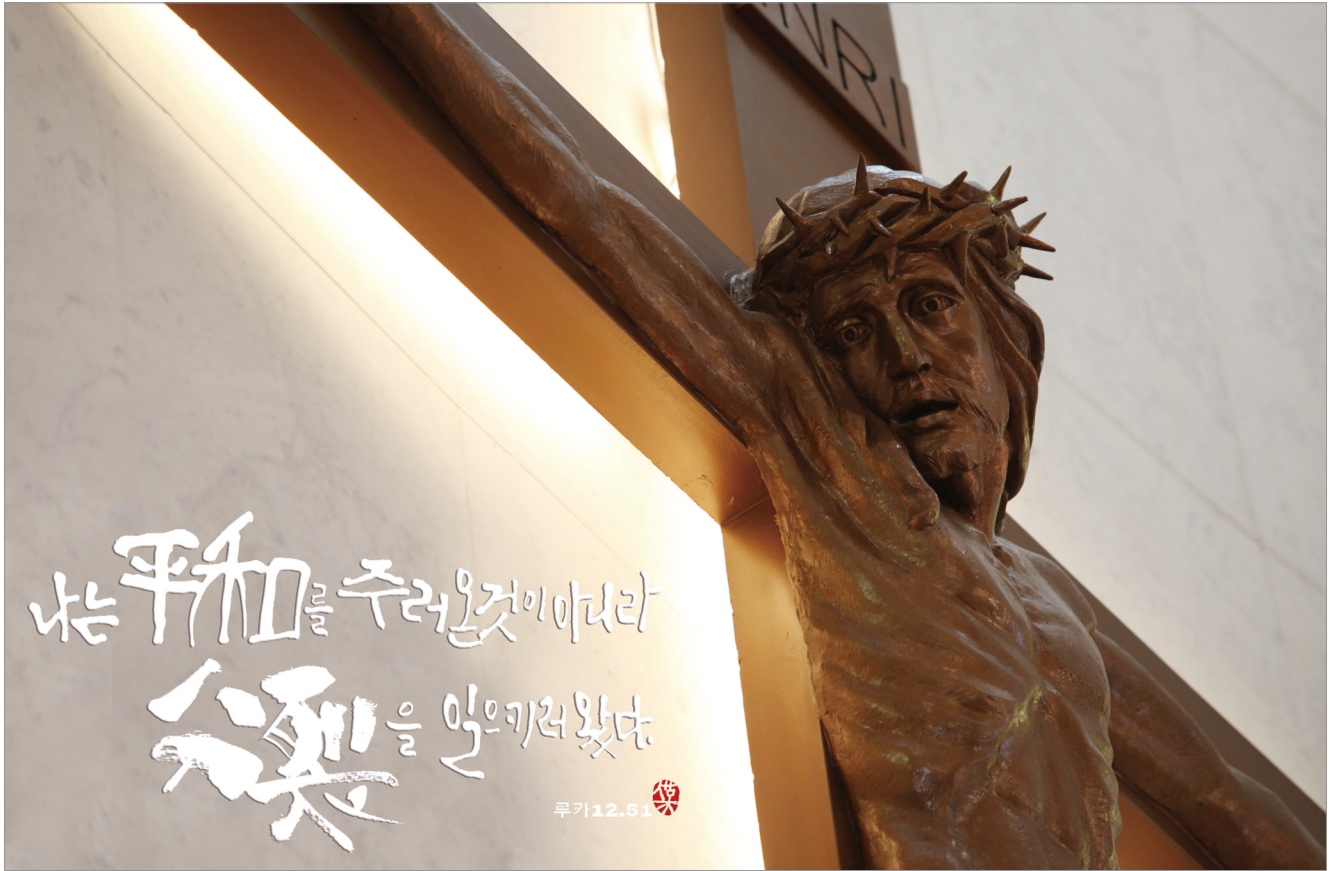
캘리그래피 : 손보영 카타리나 (덕계성당)

발행 : 천주교부산교구 | 편집 : 전산홍보국 629-8750 (48316) 부산광역시 수영구 수영로427번길 39 | jubo@catb.kr | 인쇄 : 주보인쇄사(809-2078~9)